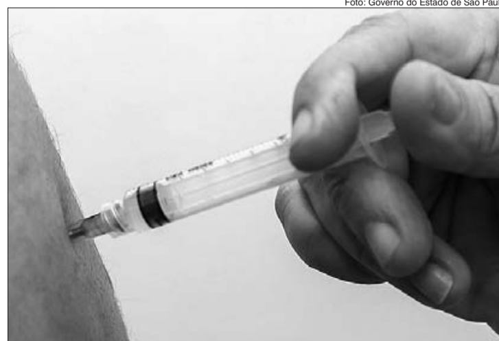
Vacinação em massa é apontada como a grande responsável pela queda dos casos e mortes por Covid

Mesmo com o elevado índice de imunização e a acenada queda no número de casos e mortes, o Estado ainda tem cerca de 5,4 milhões de pessoas em atraso com a segunda dose, o que prejudica o combate à pandemia. "O ritmo de vacinação em São Paulo é acelerado, porém é fundamental que a população complete seu esquema vacinal e tome a segunda dose da vacina. Apenas desta forma estará