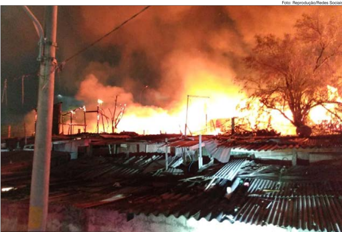
Incêndio de grandes proporções atinge comunidade da Zona Norte

Na tarde da última segunda-feira (8), um incêndio atingiu a comunidade do Boi Malhado, em Vila Nova Cachoeirinha, deixando dezenas de famílias desabrigadas. Localizada na Avenida Deputado Emilio Carlos, a comunidade fica ao lado do Hospital Cachoeirinha, que não foi atingido e manteve seu funcionamento normal.