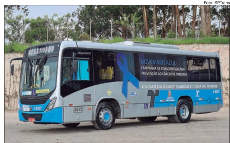
Veículos estão em circulação em todas as regiões da cidade em referência à prevenção ao Câncer de Próstata

A SPTrans apoia a iniciativa por parte das empresas concessionárias em ações de humanização do serviço de transporte com adesivagem de ônibus em homenagem às datas comemorativas. Fazem parte desta ação específica as empresas: A2, Pêssego, Transunião, MobiBrasil, Transcap e Sambaíba.