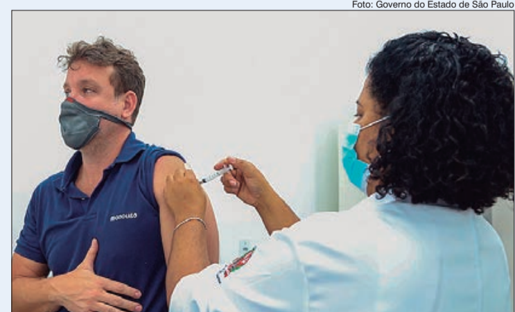
Estado de São Paulo já tem mais de 90% de sua população imunizada contra a Covid-19