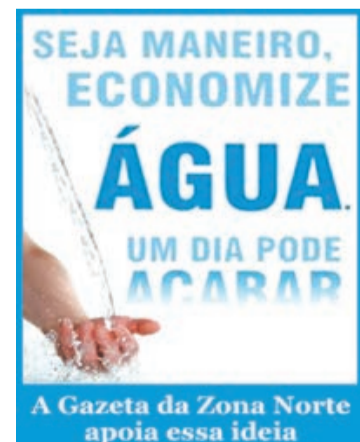
A Gazeta da Zona Norte apoia essa ideia

local na Rua Daniel Cerri, 999, 100 metros à frente do atual, para melhor acomodação dos ônibus. O itinerário da linha permanece o mesmo.