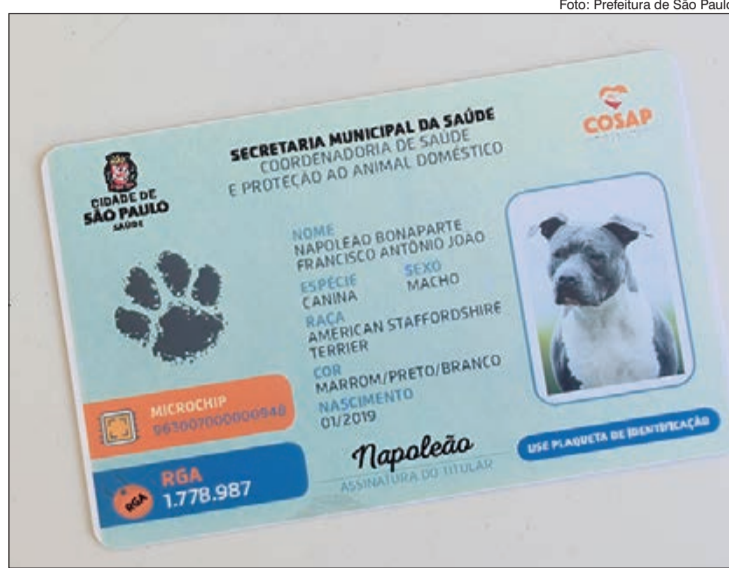
Tutores de pets podem solicitar o RGA eletrônico, documento que identifica o animal

O serviço é gratuito e também poderá ser solicitado presencialmente. Para isso, é necessário comparecer a uma das praças de atendimento da prefeitura e apresentar os documentos necessários. Confira a documentação necessária: