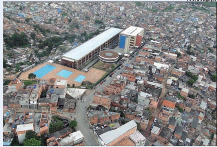
Rede municipal abre período de matrícula e rematrícula

Já para aqueles que já estão matriculados na rede municipal, rematrícula é automática,