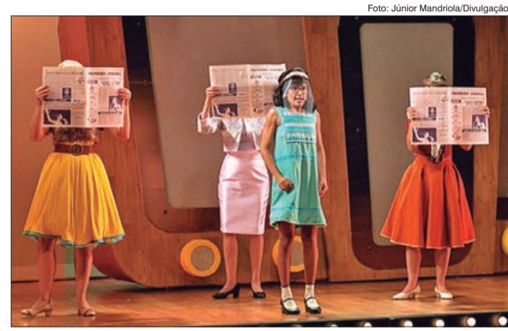
Cena de Pimentinha - Elis Regina para crianças

OS JOGOS e as práticas teatrais ajudam na percepção do mundo e do indivíduo, contribuindo para o processo de construção da autonomia criativa, consciência humana e formação do sujeito pensante e político e na vida em sociedade. A dança, pela compreensão e expansão do movimento, possibilita o desenvolvimento pleno a partir do físico - pela consciência corporal e autoconfiança. A musicalização para crianças colabora no desenvolvimento da percepção auditiva e da cognição.