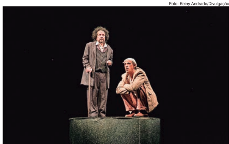
Cena de Com os Bolsos Cheios de Pão

A PEÇA NASCEU de uma história real. No começo dos anos 1980, o autor era professor de história em uma pequena vila rural, a 25 quilômetros de Bucareste. Para ir à escola, costumava pegar ônibus, metrô e trem. Nos últimos cinco quilômetros, ainda fazia o percurso de bicicleta.