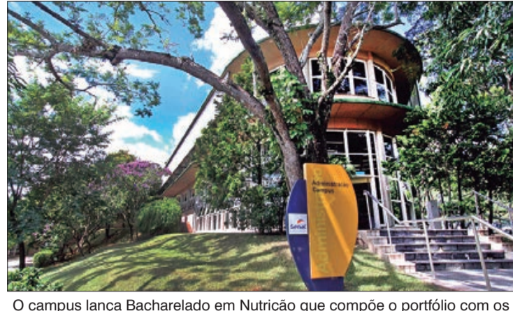
O campus lança Bacharelado em Nutrição que compõe o portfólio com os renomados cursos Tecnologia em Gastronomia e Tecnologia em Hotelaria. As inscrições ficam abertas até 18 de fevereiro

O Centro Universitário Senac - Águas de São Pedro está com inscrições abertas para o vestibular