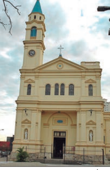
Largo da Matriz da Freguesia do Ó é um dos pontos a receber o Daruma

Praça da Liberdade e, a partir deste endereço, o Daruma será levado para outras cinco localidades da cidade: Praça da República; Praça Silva Romero; Largo da Matriz da Freguesia do Ó; Largo da Batata, encerrando o tour em frente a Japan