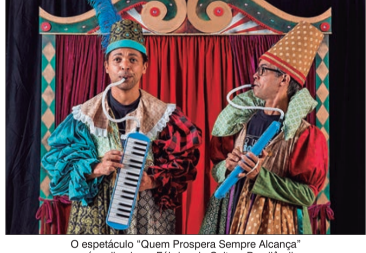
O espetáculo "Quem Prospera Sempre Alcança" será realizado na Fábrica de Cultura Brasilândia

A Zona Norte continua em destaque com as atividades da Fábrica de Cultura Vila Nova Cachoeirinha que fará exposições presenciais de curtas-metragens. No dia 19 de janeiro, às 15 horas, será exibido o curta "Brincadeiras", dirigido por Paulo Henrique Machado, que apresenta um dia vivido por crianças cadeirantes que vivem juntas. Além do cinema, a Fábrica também terá atividades voltadas para a música. Em comemoração ao Aniversário da cidade de São Paulo, no dia 20