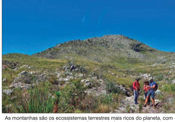
As montanhas são os ecossistemas terrestres mais ricos do planeta, com grande biodiversidade de fauna e flora; ainda é preciso conscientizar a população para a importância da sua preservação

A Serra do Mar é uma região montanhosa que se estende por, aproximadamente 1.500 quilômetros, ao longo do litoral do Sudeste e Sul do Brasil, de Santa