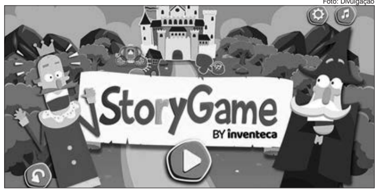
No jogo os participantes precisam organizar cronologicamente as histórias de personagens