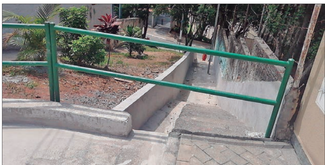
Escadaria da Rua Tramway recebe melhorias tendo em vista o período de chuvas

... principal via comercial de Vila Maria, a Avenida Guilherme Cotching conta com um importante canteiro central e uma intensa movimentação em qualquer horário do dia. Entre seus pontos referenciais estão a Igreja da Candelária e a Praça Santo Eduardo, além dos estabelecimentos comerciais, de serviços e instituições de ensino em suas proximidades. Como reflexo do crescimento da cidade, a verticalização é um traço marcante ao longo de sua extensão e em todo o entorno. Na próxima segunda-feira (17), Vila Maria comemora 105 anos de história, como um dos mais importantes bairros da Zona Norte.