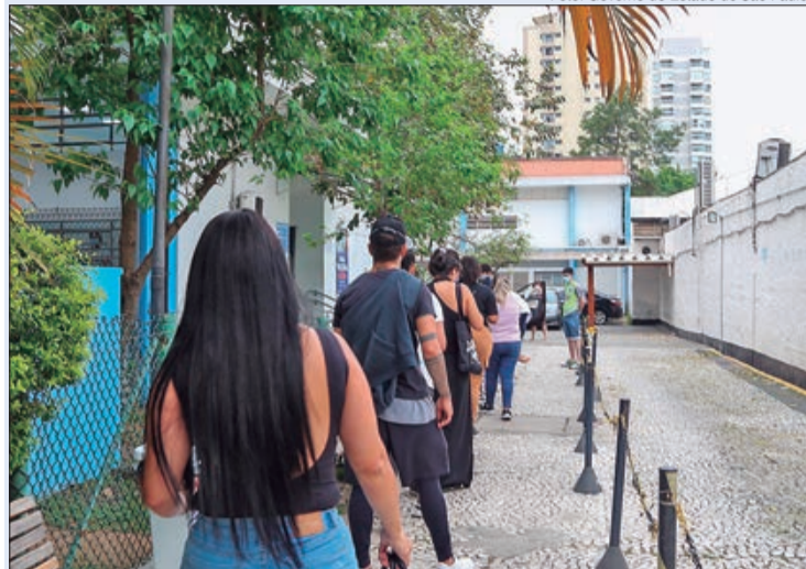
Com aumento de casos de Covid-19 e Gripe, postos de vacinação intensificam a imunização

A rede de postos de vacinação oferece a imunização contra a Covid-19 e a Gripe na cidade de São Paulo. Os cidadãos podem procurar as 469 Unidades Básicas de Saúde (UBSs) e 82 Assistências Médicas Ambulatoriais integradas com UBSs, as AMAs/UBSs Integradas, das 7 às 19 horas, além dos megapostos, drive-thru e farmácias parceiras, das 8 às 17 horas.