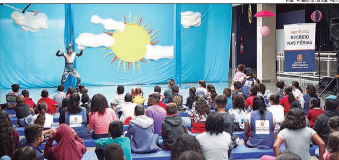
A programação acontecerá de 2ª a 6ª feira, até o dia 21 de janeiro. Podem participar crianças e adolescentes de 4 a 14 anos