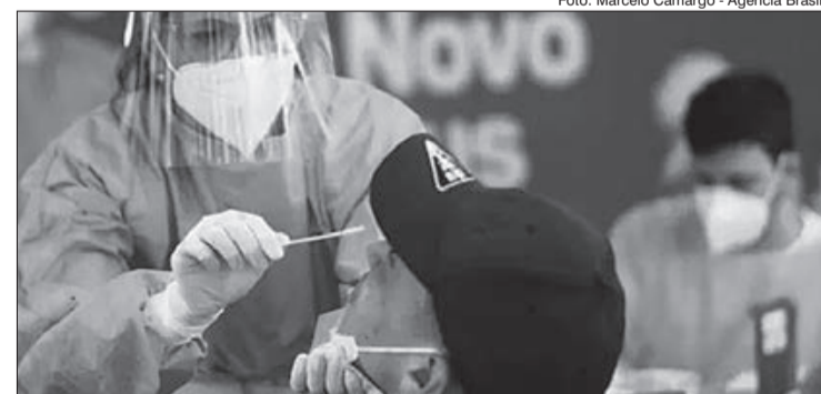
O diagnóstico será realizado de forma clínica ao público geral; testagem será ofertada para pessoas em condições de risco, que serão monitoradas por até dez dias pelas UBSs