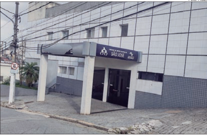
Hospital São José, no Imirim, continua desativado

A rede municipal de saúde registrou um aumento significativo na demanda de atendimento das unidades de saúde de pessoas com sintomas gripais. Em novembro de 2021, a SMS registrou um total de 111.949 atendimentos a pessoas com sintomas gripais, sendo 56.220 suspeitos de Covid-19. Neste mês, na primeira quinzena, a SMS registra um total de 91.882 atendimentos a pessoas com quadro respiratório, sendo 45.325 suspeitos de Covid-19.