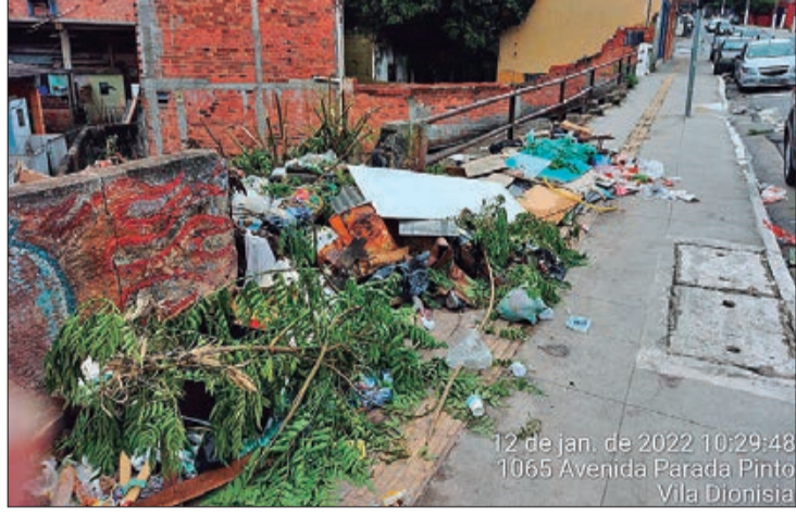
A população deve ajudar a manter a limpeza nas ruas descartando o lixo no local adequado

Na dúvida, a recomendação é contatar a LimpaSP através do telefone (11) 2307-9852 ou mande uma mensagem para contato@limpasp.com.br ou ligue para o 156. Através do site http://limpasp.com.br/cata-bagulho/ qualquer pessoa tem acesso ao cronograma de serviços programados, incluindo o cronograma do Cata-Bagulho, que passa uma vez por mês em todas as ruas da cidade, usando apenas o CEP do endereço do interessado. Através dele é possível conferir também o Ecoponto mais próximo e como utilizá-lo.