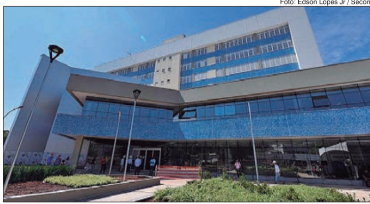
Hospital Brasilândia destinará 258 leitos para o tratamento desses casos

Após outra mobilização popular, o hospital foi reaberto pelo Governo do Estado de São Paulo em 2011 e funcionou como unidade de apoio para outras unidades da região, como Complexo Hospitalar Mandaqui