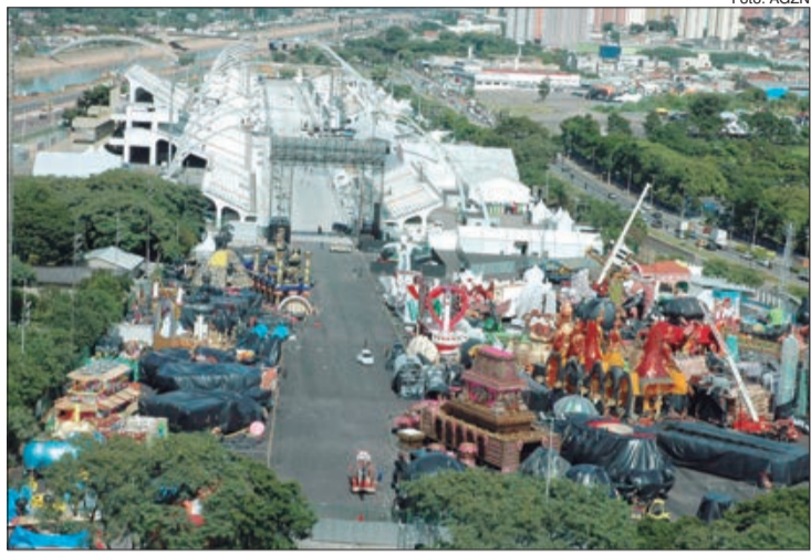
Desfiles de Carnaval são mantidos, porém com protocolos

centração e dispersão e recomendações para os ensaios técnicos e encontros nas quadras.