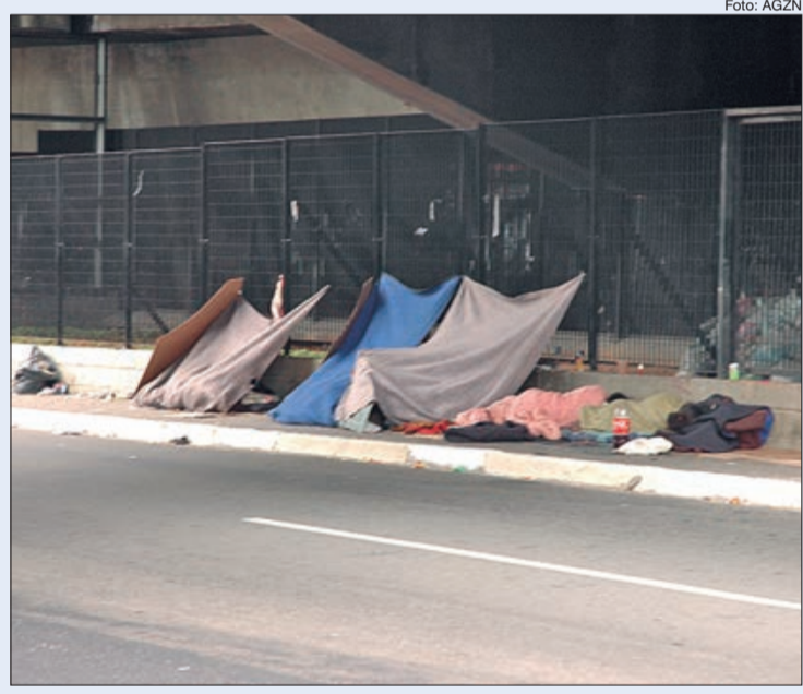
População em Situação de Rua cresceu 31%, desde o início da pandemia da Covid-19

Outra comparação que dá a dimensão da nova realidade paulistana, indica que o contingente em situação de rua já