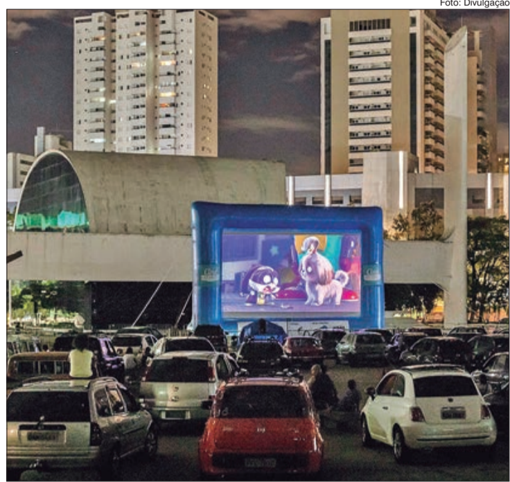
Sessões de cinema drive-in previstas para este fim de semana são canceladas

Maiores informações pelo site: cineautorama.com.br e Instagram: @cineautorama