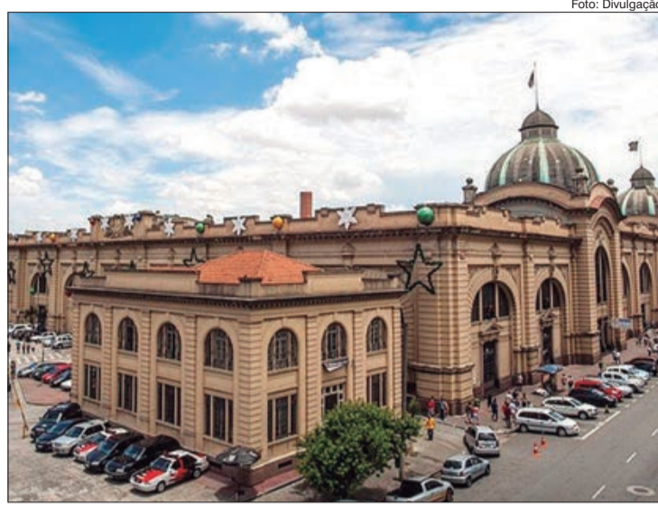
Mercadão celebra 89 anos, na mesma data do aniversário de 468 anos da cidade de São Paulo