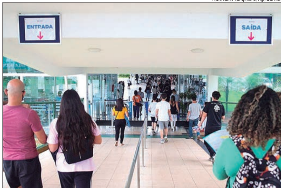
Estudantes que concluíram o Ensino Médio devem se inscrever para o Enem 2022