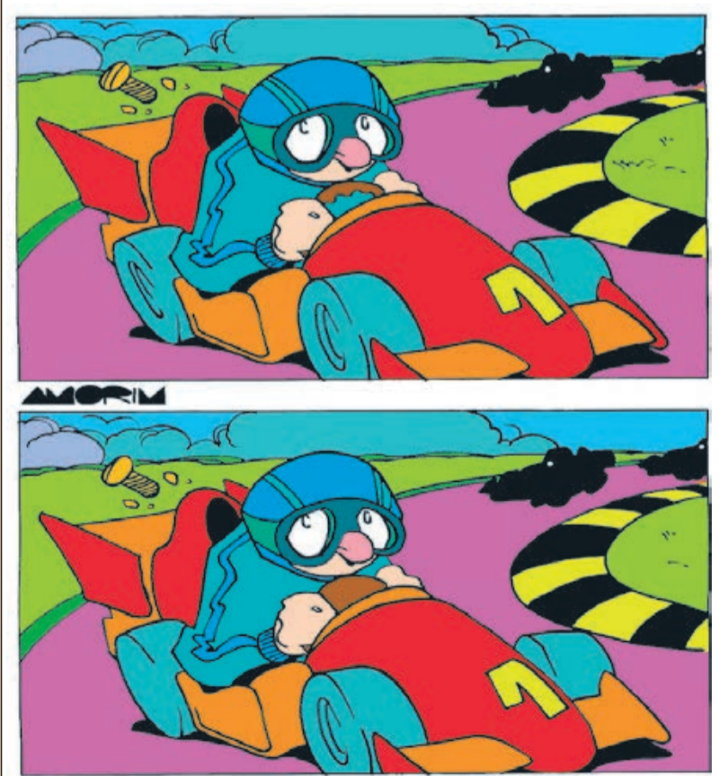
Logo dos Sete Erros: 1-parafuso; 2-roda traseira; 3-listra no capacete; 4-volante; 5-nuvem à direita; 6-aerofólio; 7-grama à direita.