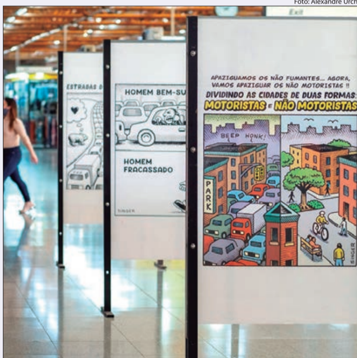
Exposição "Sem Saída" do artista Andy Singer na estação Tatuapé do metrô

O edital prevê inscrições de atividades financiadas e de adesão à programação. Serão aceitas atividades artísticas, formativas e ações com um ou mais conteúdos que tratam de temas como: consumo consciente, água, energias renováveis, biodiversidade, mudanças climáticas, mobilidade urbana, cidadania, inclusão social, combate ao racismo, redução da desigualdade social,