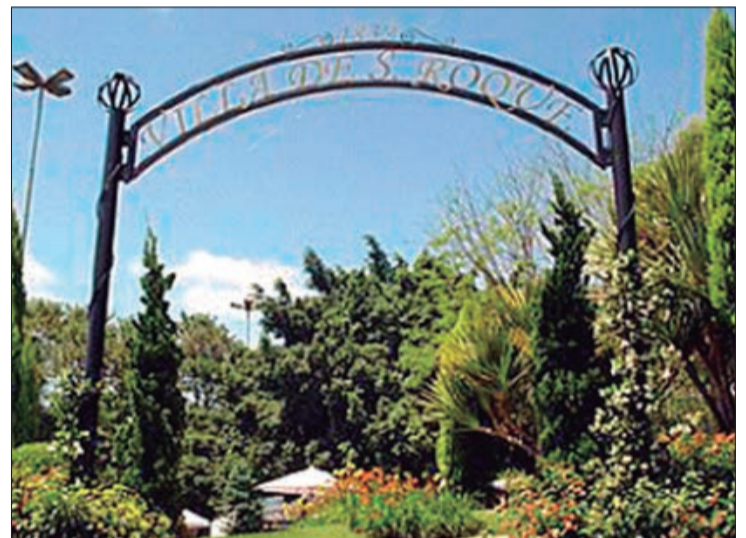
A pequena São Roque oferece o Roteiro do Vinho, com belas paisagens e muito sabor