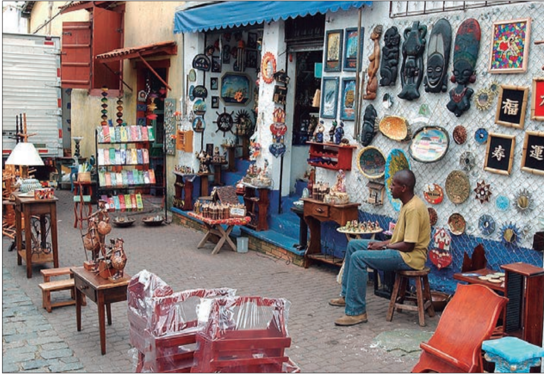
Embu das Artes é boa opção para um bate e volta próximo à capital paulista