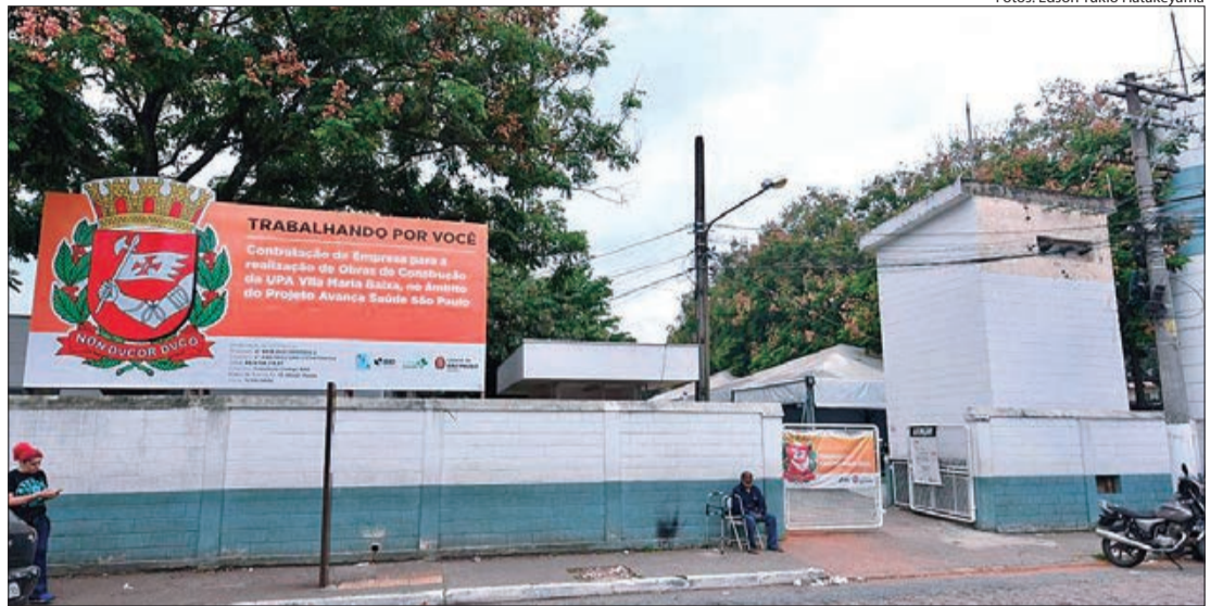
Pronto Socorro Municipal de Vila Maria Baixa deve ser transformado em UPA

ampliação dos serviços do Pronto Socorro Municipal de Vila Maria Baixa, situado na Praça Engenheiro Hugo Brandi, 15 no Parque Novo Mundo.