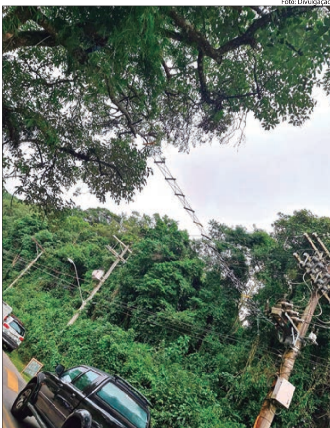
Passarela de animais são adotadas em ruas da Serra da Cantareira

Conviver com animais silvestres no quintal de casa ou mesmo atravessando a rua é uma situação frequente para quem mora ou frequenta a Serra da Cantareira. Cientes de que muitas vezes esses animais encontram-se em perigo, devido a própria ocupação da região, moradores da Serra da Cantareira se uniram numa proposta inovadora.