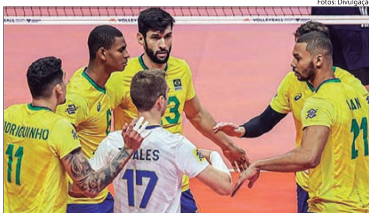
A Seleção Masculina de Vôlei tentará se recuperar na Liga das Nações, na segunda fase de jogos

TENHA UM VIVER EQUILIBRADO CONHEÇA A FILOSOFIA DO RACIONALISMO CRISTÃO Rua Gabriel Piza, 313 - Metrô Santana Reuniões 2ª, 4ª e 6ª feiras às 20 horas. Termina às 21 horas. ENTRADA FRANCA