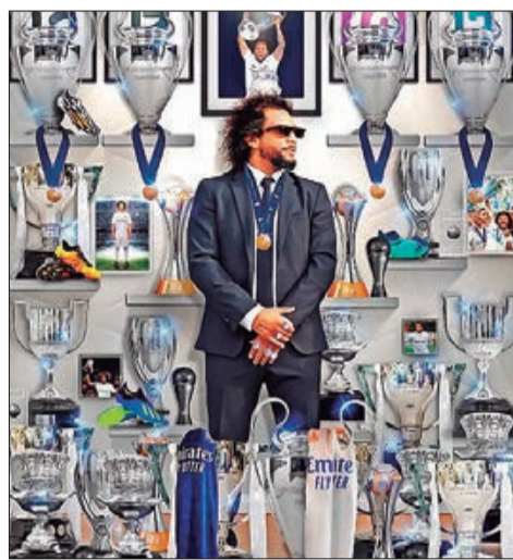
O lateral Marcelo ao lado dos 25 títulos conquistados junto ao Real Madrid

2. Com ginásio cheio, na manhã de domingo, 12 a Seleção