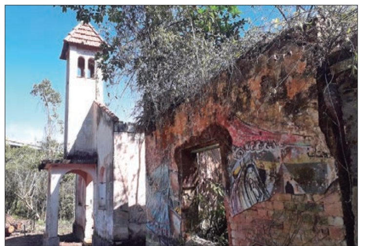
Ruína da primeira capela de Nossa Senhora da Serra

que tem ali. Atualmente, é um patrimônio histórico, e até o começo de 2023, teremos um parque linear naquela região que trará benefício para o povo. E junto com o parque virá o livro”, conta Rodrigues.