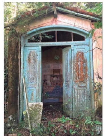
O que sobrou da capela de Nossa Senhora da Conceição, próxima a sede da fazenda do Bispo

O que ainda tem vestígio na região é uma pequena Capela de aproximadamente 1860, feita de taipa de pilão – técnica comum de construção na São Paulo do século 19, e a nova Capela, de aproximadamente 1903. Para continuarmos tendo acesso a essa rica história da nossa região algumas medidas por parte do poder público são necessárias, por isso o parque linear Córrego do Bispo é tão importante que saia do papel.