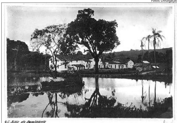
Lago em torno da casa sede da Fazenda do Bispo