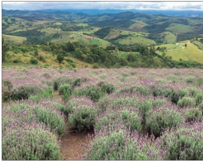
A paisagem do Lavandário é incrível e deslumbrante ao pôr do sol