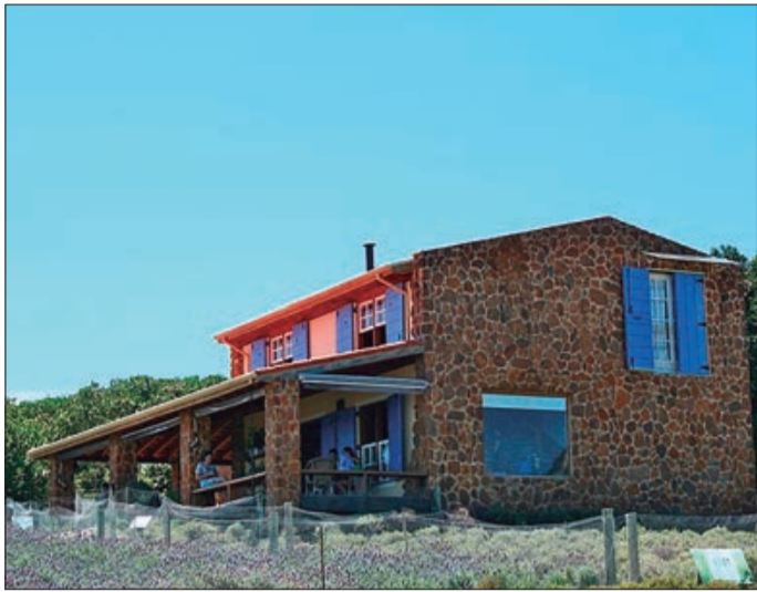
O Lavandário de Cunha é de propriedade particular e passou a receber pessoas em 2016