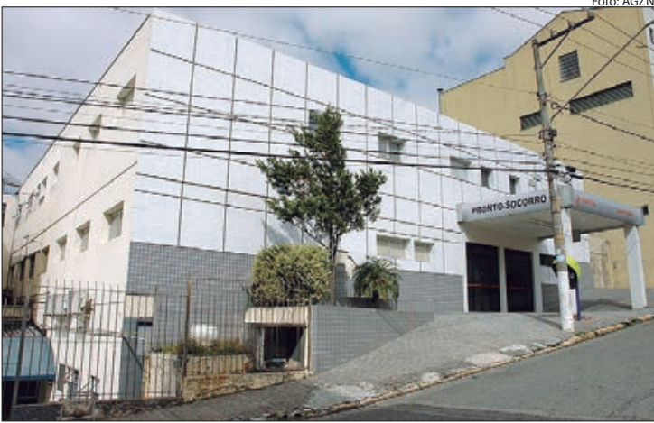
Comunidade se mobiliza em prol da reabertura de hospital no Imirim

Inicialmente, o hospital foi gerido por uma irmandade e depois vendido a uma instituição particular, que