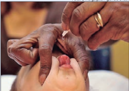
No dia 20 de agosto ocorrerá o dia D da vacinação com a abertura de todas as unidades de saúde