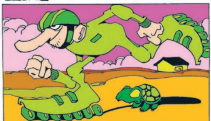
Jogo dos Sete Erros: 1-mão direita; 2-mão esquerda; 3-flecha da seta do capacete; 4-olho da tartaruga; 5-janela da casa; 6-sombra à direita; 7-rodinha do patins à direita.