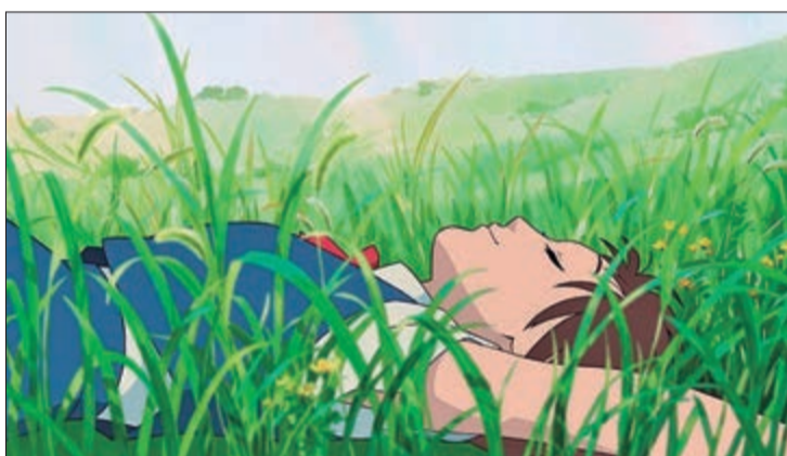
"O Reino dos Gatos" conta a história de Haru, uma menina que é convidada para conhecer o mundo dos felinos

Endereço: Avenida Luiz Dumont Villares, 579 - Jd. São Paulo Telefone: (11) 2097-1300 Estacionamento: R$ 12 a primeira hora e R$ 3 a hora adicional - desconto para credenciados.