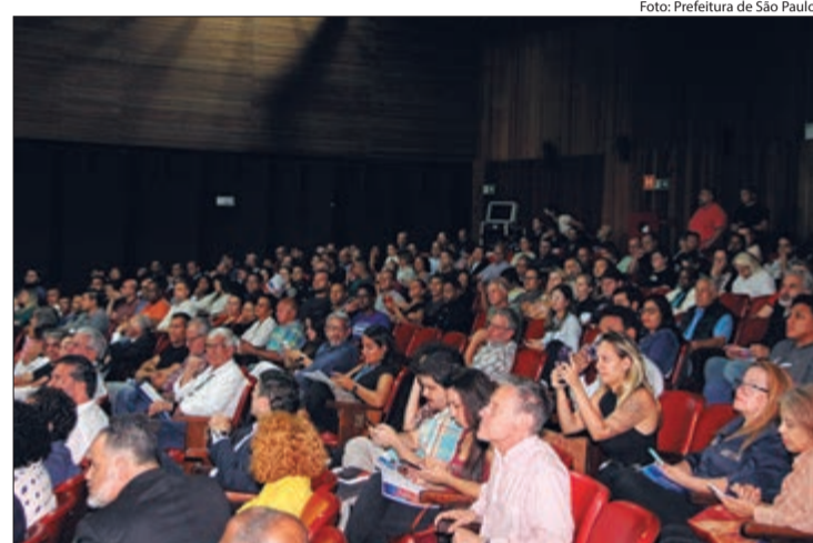
Audiências Públicas sobre o Orçamento Municipal de 2025 acontecem em abril

Além da participação presencial, é possível enviar propostas para o Orçamento de 2025 pelo site Participe Mais, na seção Orçamento Cidadão. O prazo para o envio de propostas vai de 1º a 28 de abril.