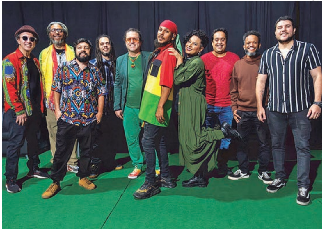
Cássia Eller é homenageada no Projeto Cássia Reggae no Teatro Sesc Santana neste sábado (6) e domingo (7)

No próximo fim de semana, nos dias 6 e 7 de abril, o Sesc Santana será palco para uma celebração única da música brasileira. O Projeto Cássia Reggae, resultado de uma potente trilogia que presta homenagem à icônica e saudosa cantora, promete encantar o público com uma fusão vibrante de ritmos jamaicanos e sucessos consagrados da artista.