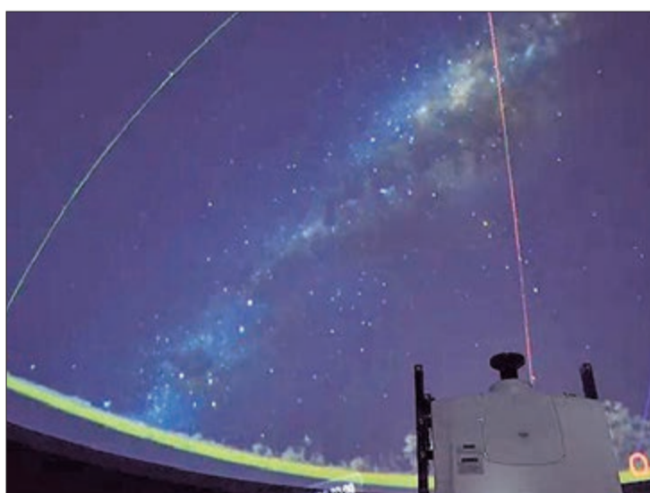
Dentro do Planetário, os visitantes podem viajar pelas estrelas, evento que agrada muito as crianças

observação a olho nu e a visita ao observatório.