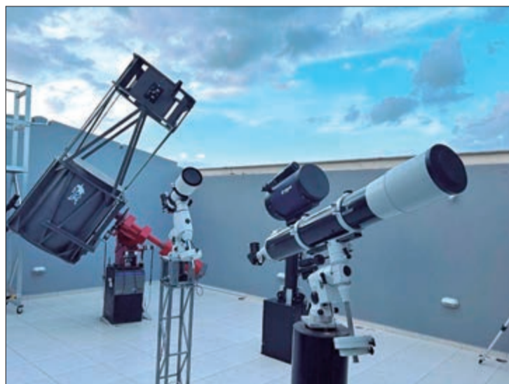
O complexo ganhou novos telescópios refletores e refratores para a observação dos astros