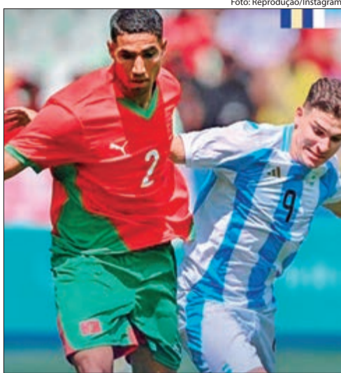
Depois de um jogo conturbado, Marrocos venceu a Argentina por 2 a 1