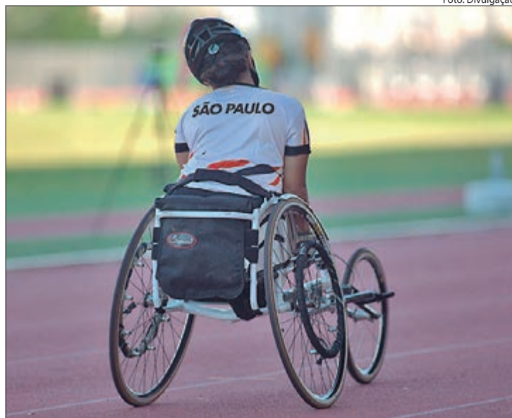
Inscrição para a etapa Paralímpica dos Jogos Escolares do Estado de São Paulo tem prazo ampliado

O JEESP tem como objetivo promover a inclusão,