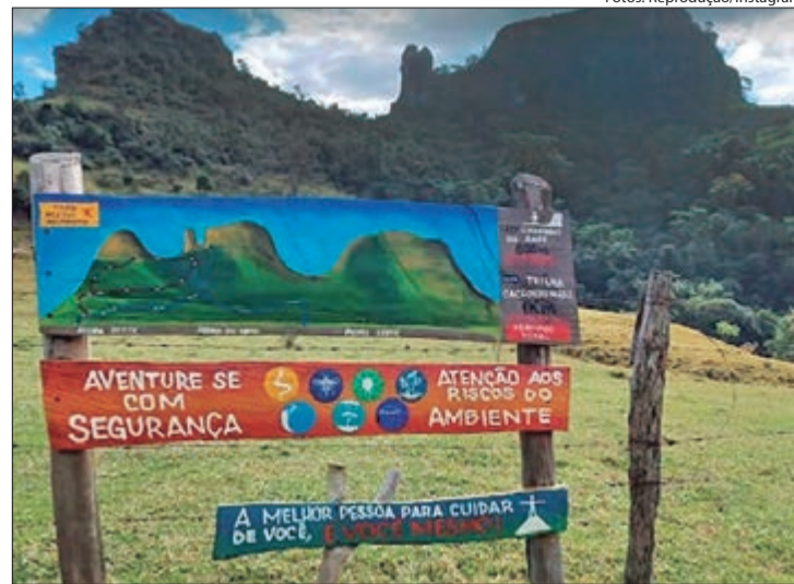
Um dos destaques é a Tirolesa do Gigante, com 800 metros de extensão, que permite ver a cidade lá do alto

são marcados pelas influências italianas, alemãs e portuguesas. Um dos lugares mais emblemáticos é a Venda do Vivan. Fundada em 1946, ela conserva o espírito rural do interior e