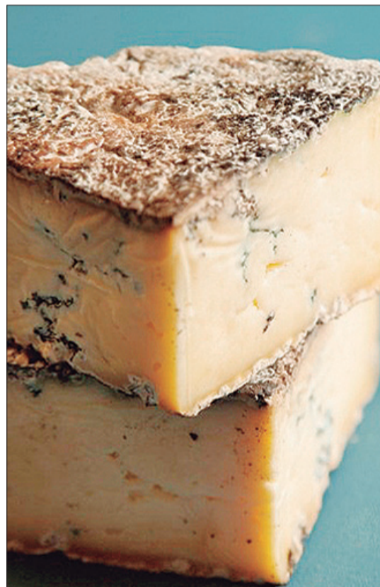
Para aqueles que apreciam queijos da família dos "Azuis", o CuestAzul é uma das produções da Pardinho Artesanal que ficou conhecido pelo mundo