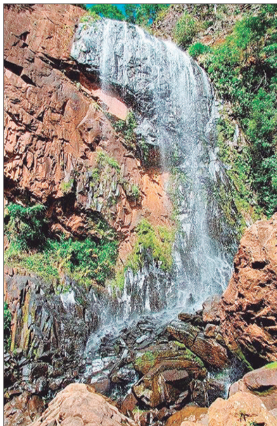
No local existem trilhas e muita natureza exuberante para conhecer, assim como as cachoeiras locais

A culinária é outro grande atrativo. Além dos queijos premiados, os sabores da cidade