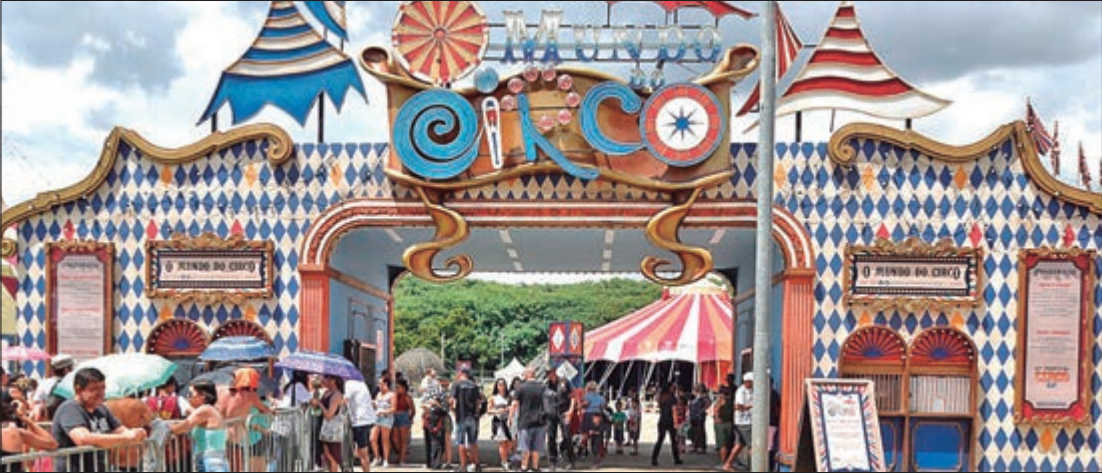
O Mundo do Circo continua com sua programação especial do Mês das Crianças, oferecendo espetáculos gratuitos e abertos para toda a família

O Mundo do Circo SP, iniciativa da Secretaria da Cultura, Economia e Indústria Criativas do Estado de São Paulo, gerenciada pela Associação Paulista dos Amigos da Arte, continua com sua programação especial do Mês das Crianças, oferecendo espetáculos gratuitos e abertos para toda família. As apresentações seguem até o fim de outubro, com atrações que unem humor, magia, música e acrobacias no parque localizada na Zona Norte da capital. No dia 18 sábado, às 17h a Cia Painé Santamaria apresenta A Louca das Frutas, em que Chiquita, uma feirante cheia de energia e emoção, transforma a venda de frutas em um espetáculo de malabarismo e humor. No domingo dia 19, às 17h é a vez de: Viva o Palhaço Mixuruca, que une