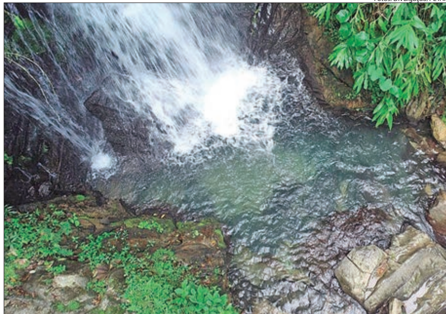
Fechada ao público desde 2003, após um acidente, a Casa de Pedra recebeu equipamentos para medir a chuva e no futuro abrir para visitação de maneira segura