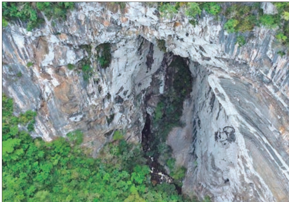
Caverna Casa de Pedra, localizada no Parque Estadual Turístico do Alto Ribeira abriga a maior abertura vertical de caverna do mundo