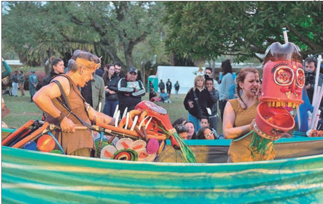
Inspirada no mito da lara, a peça Água Doce, da Cia da Tribo traz uma linguagem poética, música, bonecos e elementos da cultura popular

A premiada peça “Água Doce”, da Cia da Tribo, será apresentada, gratuitamente, no dia 8/3, às 16h no Parque do Trote, na ZN. Voltado para crianças e famílias, o espetáculo convida o público a refletir sobre a importância da preservação da água e dos rios soterrados da capital paulista.