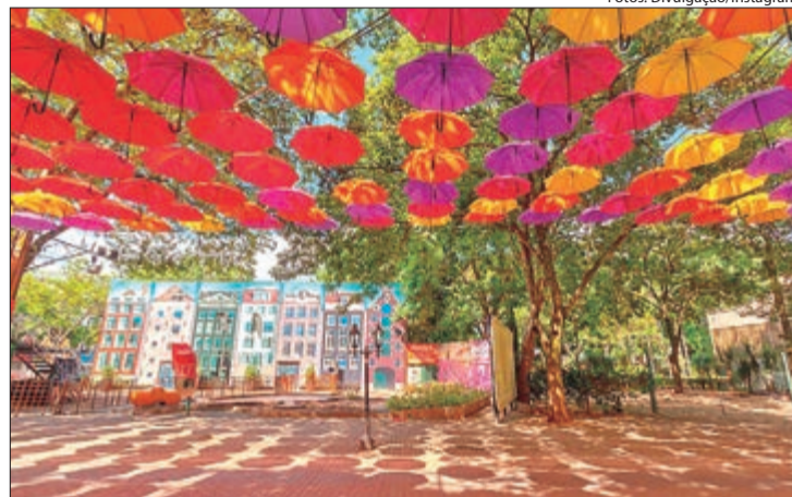
Holambra pode ser um dos próximos destinos do projeto, que promete encantar com suas lojinhas e os campos de flores

As inscrições não são individuais. Prefeituras e organizações sociais são responsáveis por formar grupos entre 25 e 45 pessoas, com acompanhamento obrigatório de um responsável durante toda a viagem, sendo que até 20% do grupo pode ser composto por