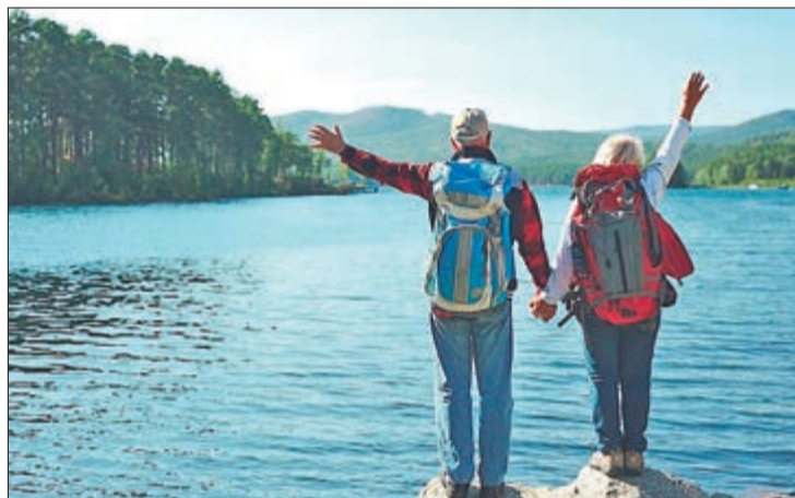
O Projeto Turismo60+ oferece viagens gratuitas para pessoas com mais de 60 anos pelo Estado de São Paulo

O programa oferece uma experiência completa, com serviços de alimentação, hospedagem, passeios, seguro viagem, guia de turismo e kit viagem, formado por camiseta, garrafinha de água e viseira, especialmente voltada para quem nunca teve oportunidade de viajar pelo estado. Na primeira etapa, que