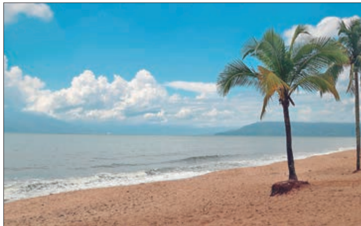
Cidades litorâneas como Caraguatatuba estão no roteiro do projeto 60+, assim como Ubatuba, Santos e Guarujá

foi realizada em dezembro de 2025, 203 viajantes de cidades como: Tabapuã, Santa Lúcia, Presidente Epitácio, Estiva Gerbi e da capital paulista visitaram destinos como: Águas de Lindóia, Mongaguá, Serra Negra e Socorro, marcando o início do projeto.