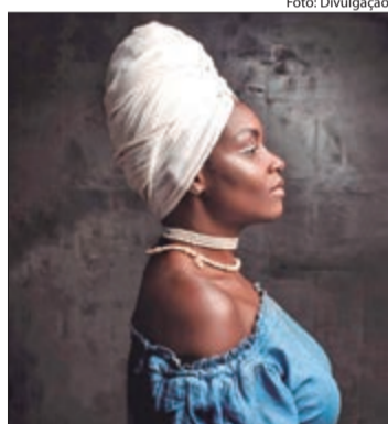
O musical “Bertoleza”, é uma releitura contemporânea do clássico naturalista “O Cortiço”, de Aluísio Azevedo

A trama acompanha a relação entre João Romão e Bertoleza, marcada pela promessa de alforria e pela