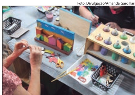
As atividades são distribuídas ao longo de março e abril, com opções gratuitas e pagas, com propostas que unem prática manual, criativa e tecnologia

O Sesc Santana está com inscrições abertas para cursos e oficinas no Espaço de Tecnologias e Artes (ETA), com atividades entre 3 de março e 29 de abril de 2026. A programação inclui eletrônica criativa, encadernação artesanal, cerâmica e marcenaria,