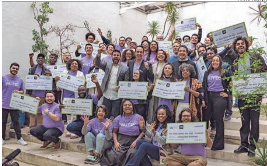
Programa de aceleração de startups amplia prazo de inscrição

A Prefeitura de São Paulo prorrogou até 10 de março, as inscrições para a 11ª edição do VAI TEC, programa de aceleração de startups voltado para iniciativas tecnológicas com impacto social. O cadastro deve ser feito pelo site da ADE SAMPA.