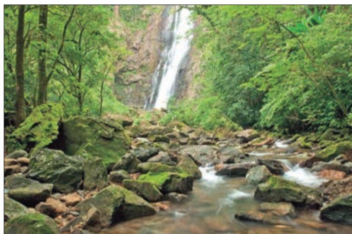
No Rio de Janeiro (RJ), a Floresta da Tijuca reúne quase 100 trilhas ecológicas, muitas delas indicadas para crianças

A proposta é incentivar momentos de pausa, reduzir o tempo de telas e promover experiências ao ar livre que unam lazer, aprendizado e qualidade de vida para toda a família.