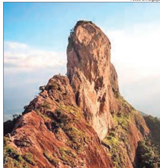
Em São Bento do Sapucaí (SP), a Trilha do Bauzinho leva a um mirante com vista panorâmica para a Pedra do Baú

dos Veadeiros (GO), trilhas de nível fácil levam a cachoeiras de águas cristalinas, como a dos Cristais e a Santa Bárbara. Já em Florianópolis (SC), a Trilha do Rio Vermelho proporciona uma experiência guiada de Educação Ambiental em meio à fauna local.