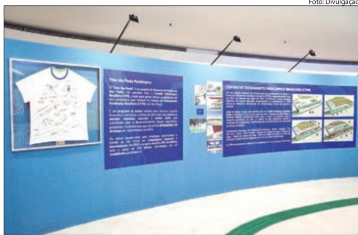
Exposição sobre o Comitê Paralímpico Brasileiro pode ser visitada até dia 4 de março