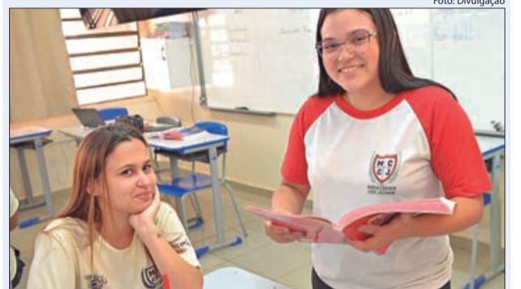
Inscrições para Programa Aluno Monitor do BEEM seguem abertas até dia 6 de março

A Secretaria da Educação do Estado de São Paulo abriu 5.284 vagas na capital e Grande São Paulo para o Programa Aluno Monitor do BEEM. As oportunidades são para estudantes do Ensino Médio que queiram atuar em Língua Portuguesa ou Matemática. As inscrições vão até 6 de março.