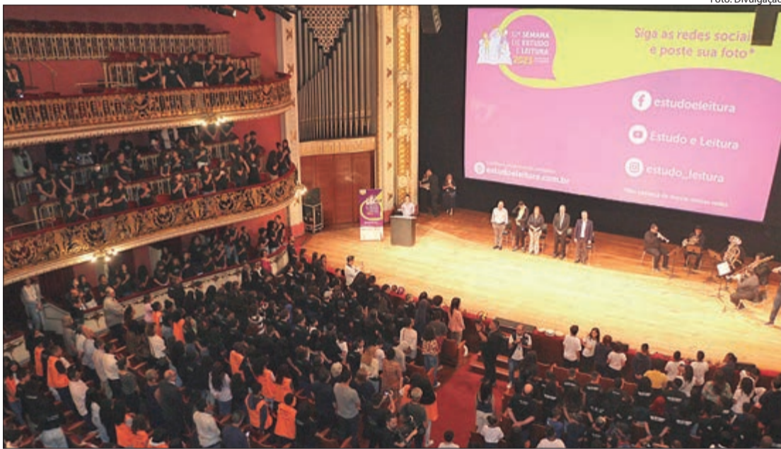
A ação integra o calendário oficial da cidade, promovendo discussões contemporâneas sobre Literatura e Tecnologia

A cidade de São Paulo recebe, a partir de 6 de maio, a 15ª edição da Semana Municipal de Incentivo e Orientação ao Estudo e à Leitura, com programação gratuita que une Literatura e Inovação. O evento tem início no Theatro Municipal de São Paulo e segue até o dia 15/5, com encerramento na Biblioteca Mário de Andrade.