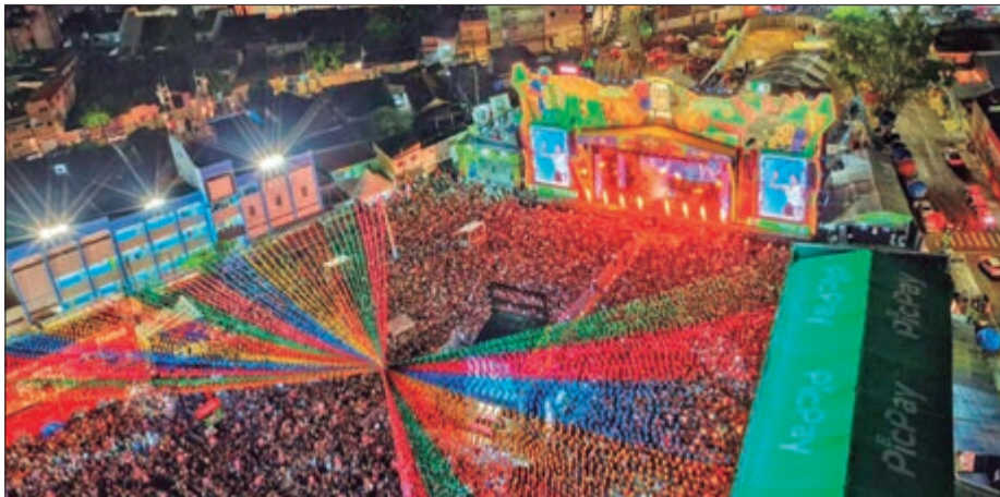
Em Campina Grande na Paraíba o tradicional “Maior São João do Mundo”, tem a expectativa de receber 3,2 milhões de visitantes