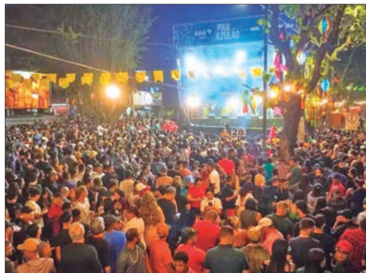
Já em Caruaru, Pernambuco, o São João terá mais de 70 dias de programação, começou em abril e vai até 27 de junho

Somadas, as três festas representam um dos maiores movimentos turísticos do calendário brasileiro, impulsionando hotéis, restaurantes, comércio e serviços