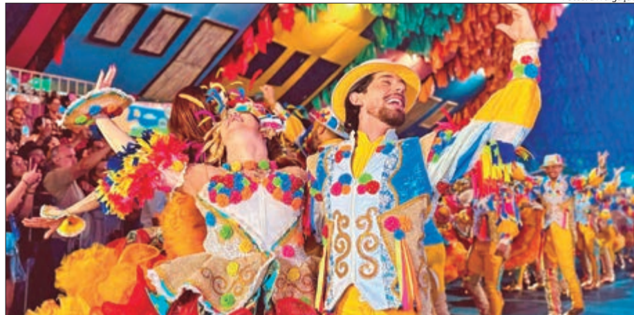
Com grandes shows, quadrilhas, gastronomia típica e manifestações culturais, as festas juninas se tornam um dos destinos preferidos no mês